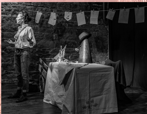
- Presqu'illisible -

De la conjugaison entre ces différentes relations au territoire, naissent des créations aux formes participatives, hybrides, entre l'atelier et le spectacle. Vastes d'imaginaires, chargées de poésie, elles viennent travailler les notions de genre, de mémoire, de collectif, les modalités de relation entre savoir et faire et le rapport des individus à leur environnement.