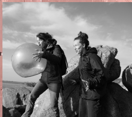
- La Déserte -

Spectacle discrètement participatif pour une factrice et son atelier d'écriture