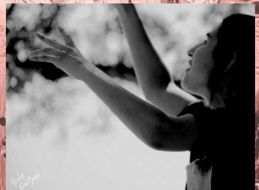
- Le Carrousel du flare -

Seul en scène pour phares et boîtes noires